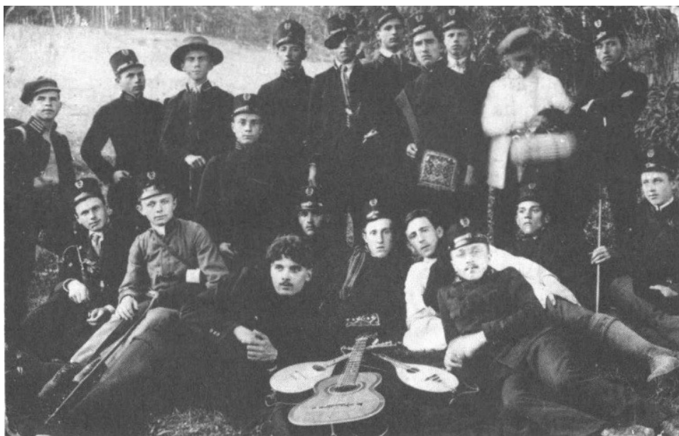
Бережанські гімназисти сьомого класу навчання, 1912 р. [1]

Окремої уваги заслуговує спортивна одіж. Уроки руханки передбачали переодягання. На серії фото з гімназійного спортзалу бачимо білі футболки й майки, деякі із монограмою патрона закладу Ридза Смігли ERS. А також широкі шорти й гімнастичні балетки у дівчат та легке спортивне взуття у хлопців.