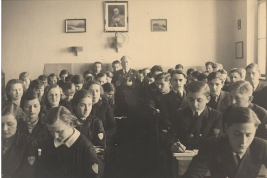
Бережанські гімназисти на межі 20-30 х. рр. ХХ ст. [7]

Піджаки стали двобортними із двома рядами гудзиків, а також доповнилися широкими прямокутними лацканами, практично на всю ширину грудей. Лівий рукав піджака містив нашивку у вигляді герба й цифрової позначки 604, вона вказувала на загальнодержавний номер Бережанської гімназії [8], [10].