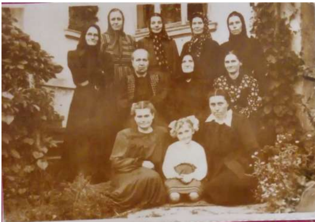
Сестри в часи підпілля в приватному будинку по вул.Ковшевича 10