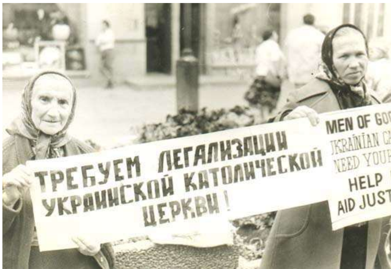
с.Леонтія(праворуч) з протестним плакатом на вул. Арбат м.Москва