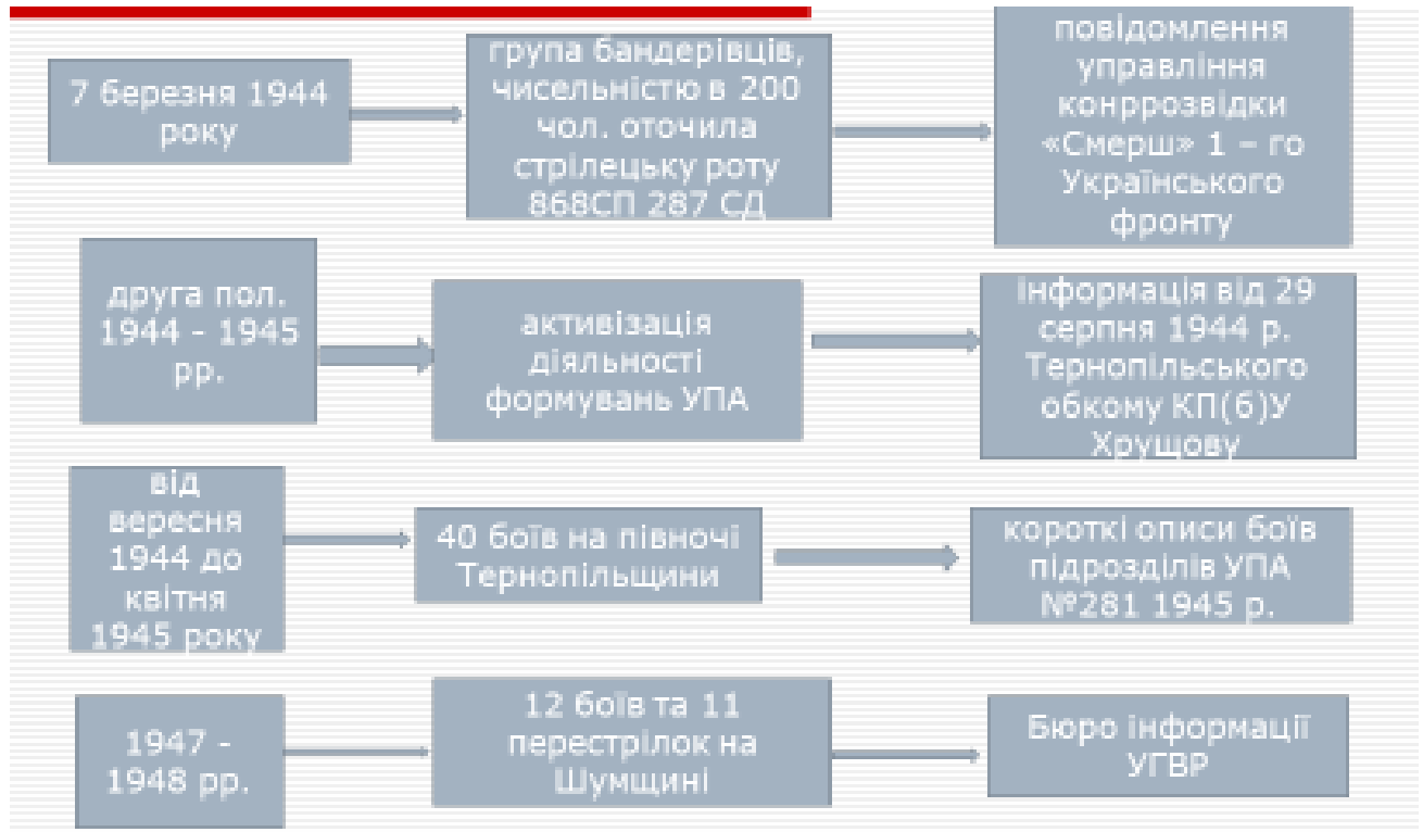
Схема «Документи про боротьбу УПА»