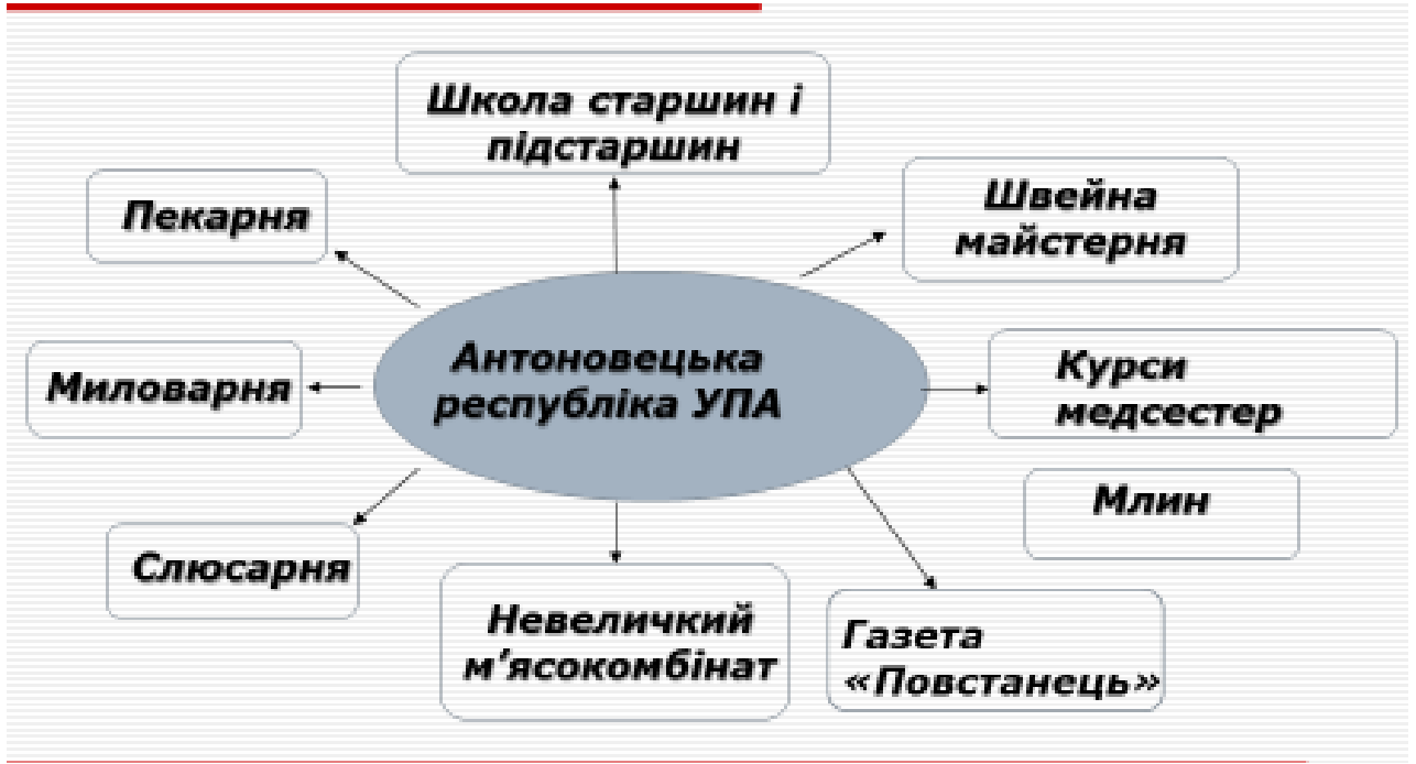
Схема «Антоновецька республіка УПА»