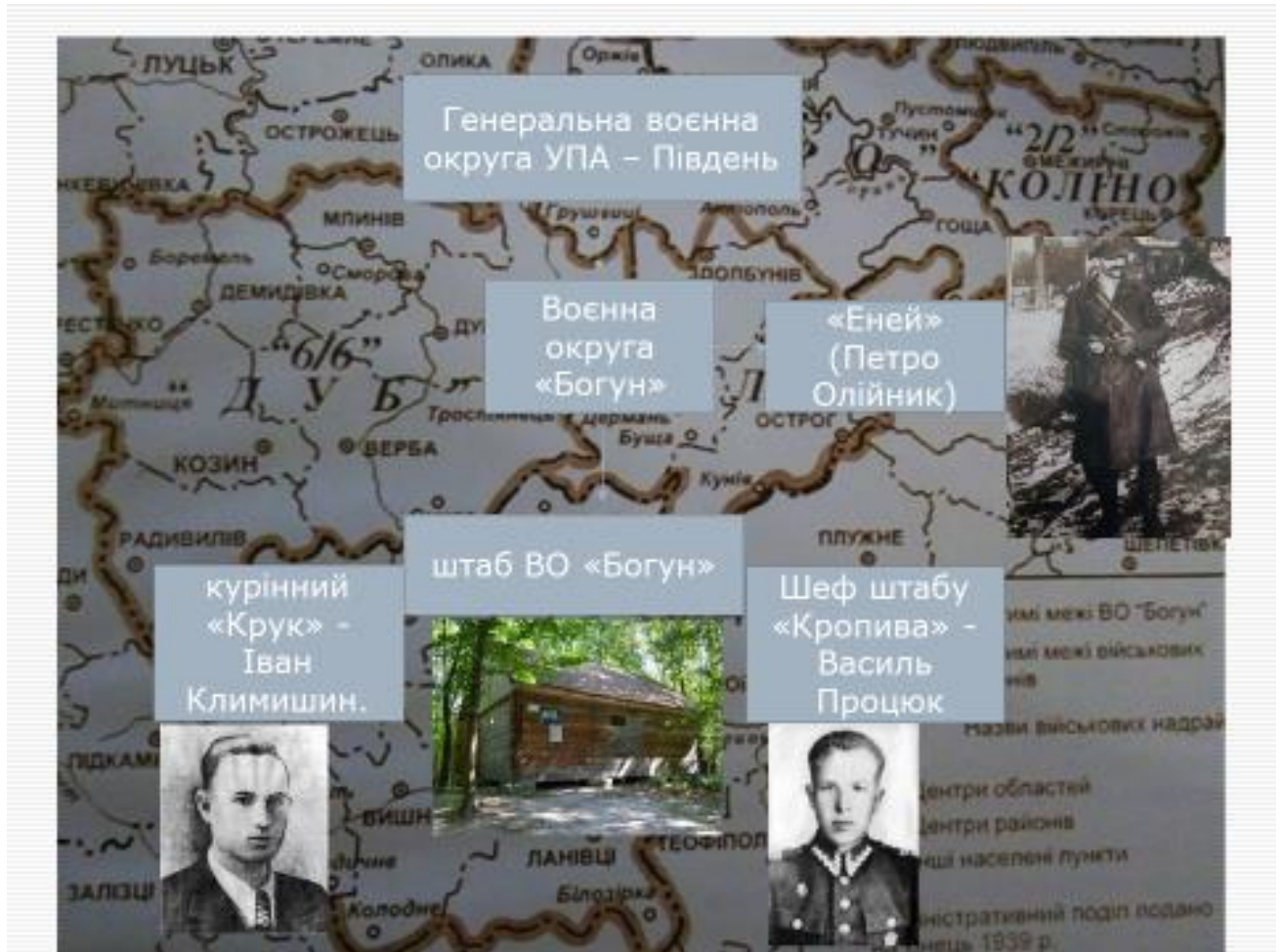
Схема «Військової округи УПА «Богун»