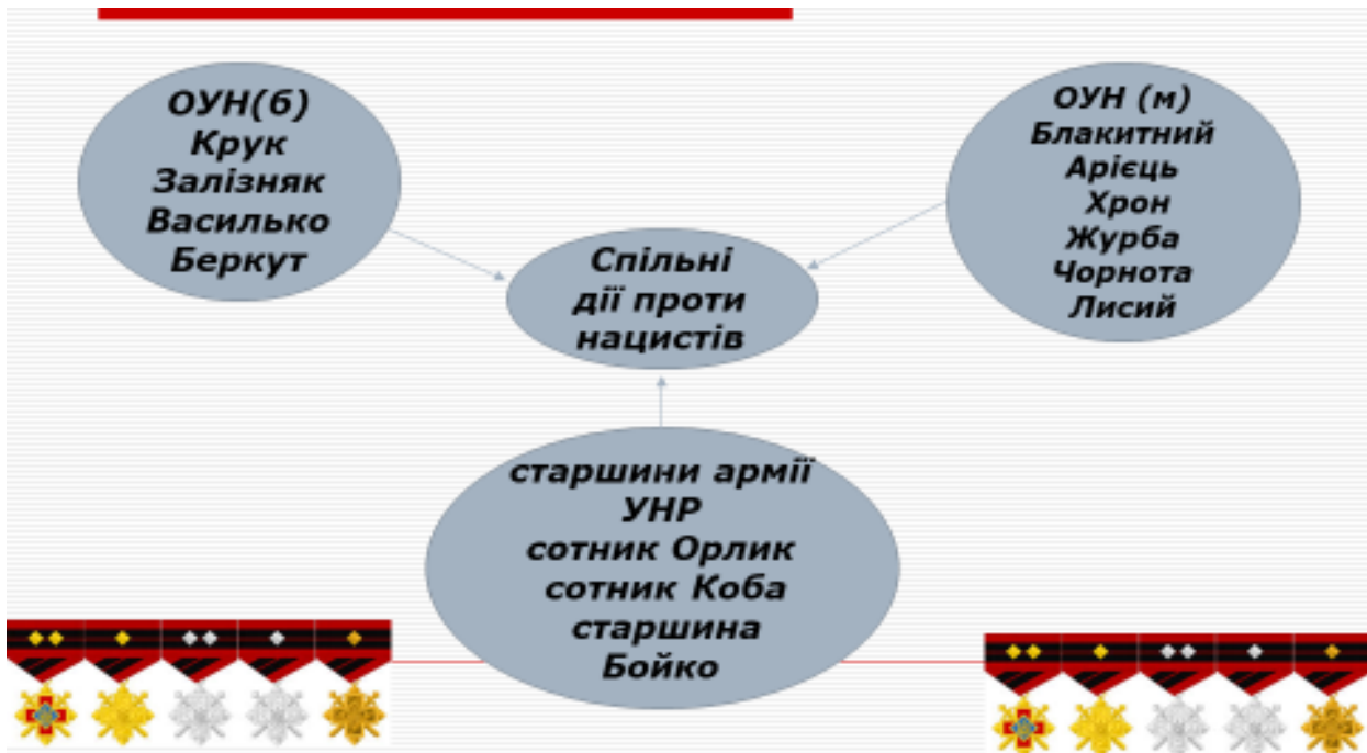
Схема «Об'єднавча конференція визвольного руху на півночі Тернопільщини» (13.05.1943р.)