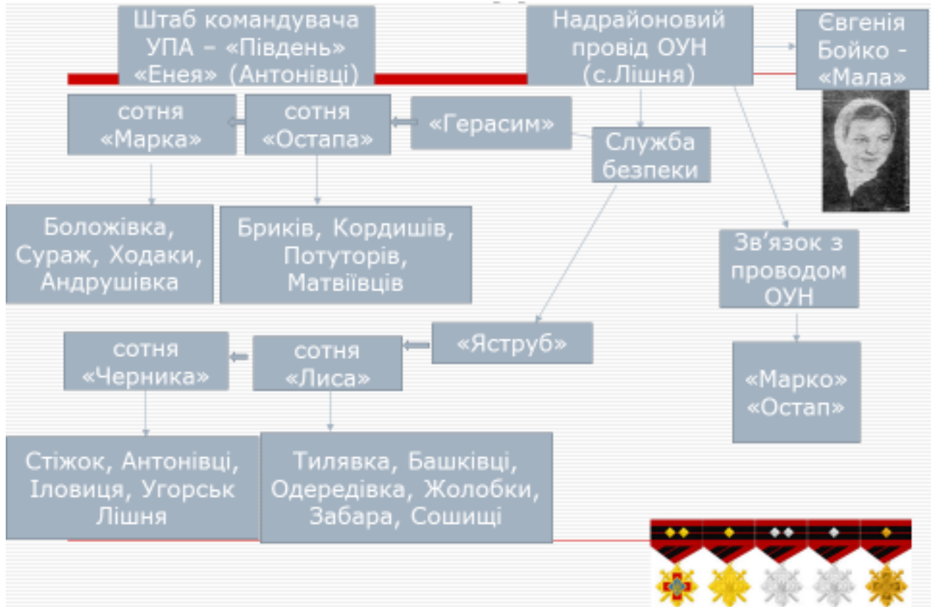
Схема «Структура УПА на Шумщині у другій половині 40-х рр.»