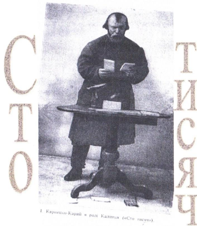
І. Карпенко-Карий в ролі Калігали («Сто тисяч»).

Згубний вплив грошей на персонажів комедії Івана Карпенка-Карого "Сто тисяч".