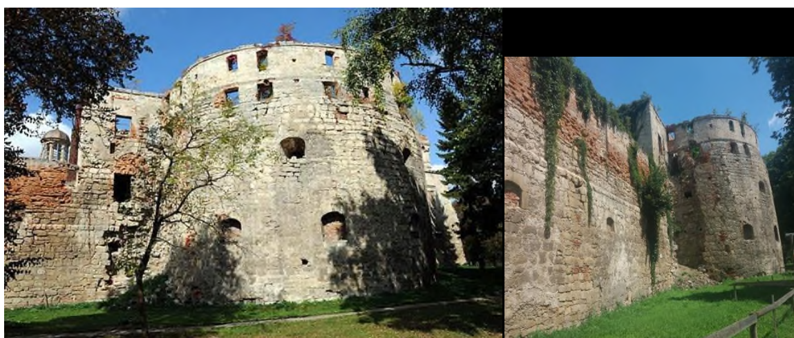
Фото 4. Бережанський замок: минуле та сьогодення

З розділу «Пробудження свідомості» ми дізнаємося, що у 1772 році, після першого поділу Польщі, західноукраїнські землі відійшли до складу Австрійської імперії. Із записів І. П. Герети стало відомо, що за новим адміністративним поділом 1781 р. Галичина ділилася на циркули (округи), а ті, в свою чергу, на повіти. Центром одного з округів (їх на Тернопільщині було три) стали Бережани. Такий адміністративний поділ у краї зберігся в основному аж до 1867 року. Також надзвичайно цікавою є позиція І. Герети щодо освітніх закладів того часу. У авторських коментарях читаємо: «В освітніх закладах уряд вбачає те зручне знаряддя, за допомогою якого можна було готувати відданих слуг, покірних і слухняних виконавців своєї волі. Проте це не завжди вдавалося, особливо в подальші роки існування Бережанської гімназії»