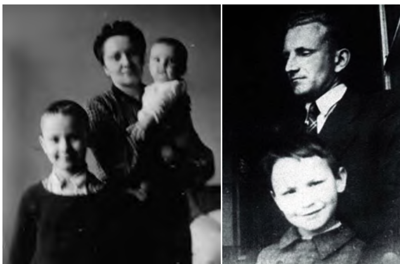
Фото 3, 4. Сім'я Романа Шухевича

А яким важким для Романа Шухевича було пожертвування своїм родинним щастям. Він дуже любив свою дружину і дітей, та любов до України була вищою. Це лише Богові відомо, що мусив відчувати він, живучи віддалено від них, довідавшись про арешт дружини та поміщення дітей в інтернати ( див фото 3, 4 ).