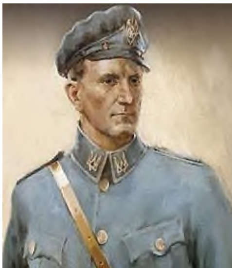
Фото 5. Роман Шухевич

та джерело їх моральної сили вести боротьбу за волю нації і людини, щоб здобути перемогу або по-геройськи загинути.