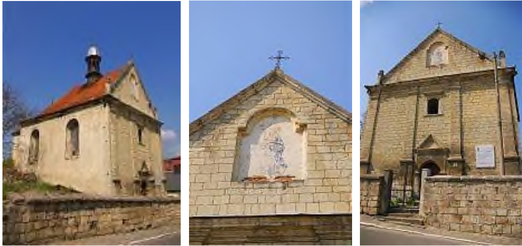
Фото 4. Вірменська церква в Бережанах

Важливою пам'яткою архітектури також є Бережанський замок. У 1554 році закінчилося спорудження кам'яного замку, який у 1570 р. та першій чверті XVII ст. було розбудовано житловими будинками, зовнішні стіни яких мали бійниці. Замок вражав своїми розкішними будівлями: «фасадами з великими вікнами й вишуканими двоярусними відкритими аркадами-галереями вони нагадують італійські палаццо» [3, с. 7].