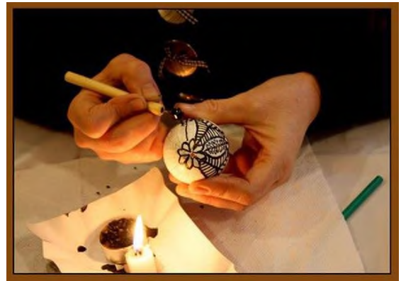
Майстер-клас з писанкарства для молоді у м. Лисичанськ (2016 р.)

Учасники організацій беруть активну участь у благодійних акціях (Всеукраїнська акція «Серце до серця»), що привчає молодих людей до того, що треба допомагати іншим у скрутну хвилину життя, навчає бути милосердними і небайдужими до чужої біди. Великий вклад у збереження історичних та культурних місць рідного краю зробила «Молода Просвіта», долучившись до впорядкування території на горі Бона у м. Кременець, до акції «Пам'ятаймо минуле заради майбутнього» (30 представників разом із іншими молодіжними організаціями впорядкували майже сотню могил Українських Січових стрільців).