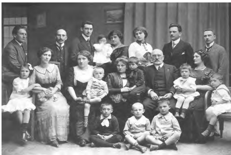
Фото 1. Родина Романа Шухевича

Роман Шухевич був, як казали на Галичині, з доброї родини, яка шанувала традиції, могла похвалитися відомими особистостями, яких поважали в суспільстві [8, с. 15–18].