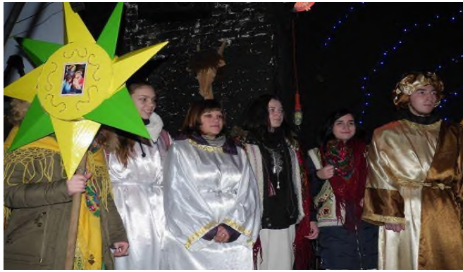
Вертепне дійство на Сході (2016 р.)