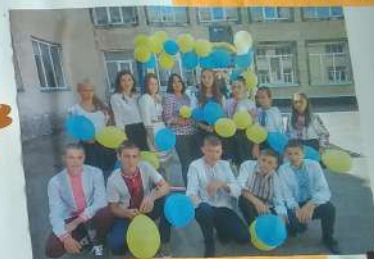
Vormittags, abends, im Freien, im Zimmer ... Wann Freunde wichtig sind? Eigentlich immer!