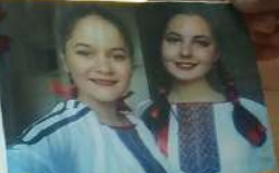
Freunde erkennt man in der not.