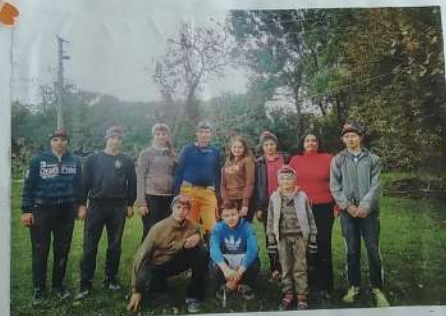
Freunde sind wichtig zum Sandburgenbauen, Freunde sind wichtig wenn andre dich hauen, Freunde sind wichtig zum Schneckenhaussuchen, Freunde sind wichtig zum Essen von Kuchen.