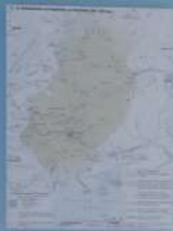
За часів князів Володимир та Святослав

Першу державу на наших теренах, історичники називали Київська Русь. Маючи до 100 тисяч років, Україна її поховала в межах сучасної України. Київська Русь, яка за перших князів стала цвинем і найбільшою державою Східної Європи. Це за часів Аскольда, Діра та Свена зростає могутність Київської держави, уможливується її розширення. Вони гадать, що саме за цих князів завершується становлення Київської Русі. У наступні роки її авторитет невідомо зростає, Русь знову виходить за межі наших кордонів, Ольги та Святослава, котрим належить довести для цього надзвичайні зусилля.