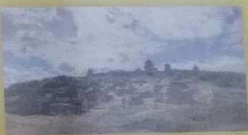
о.Мала Хортиця 1556р.