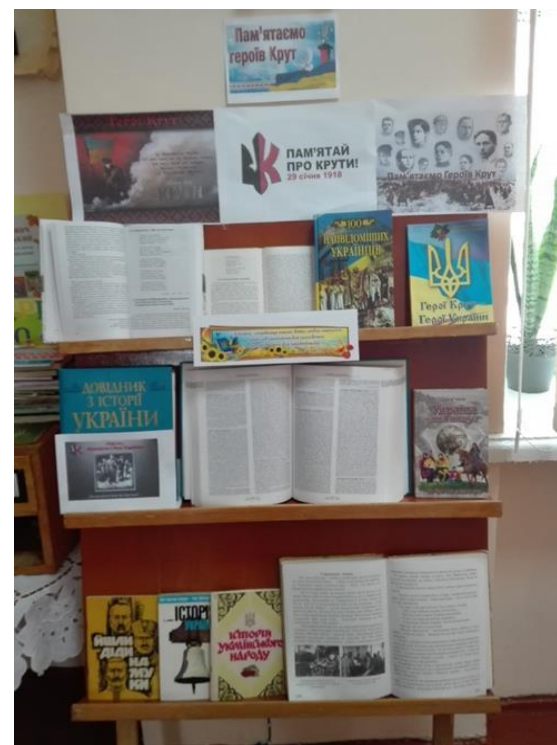
Виставка-реквієм «КРУТИ – наша слава, наша історія»