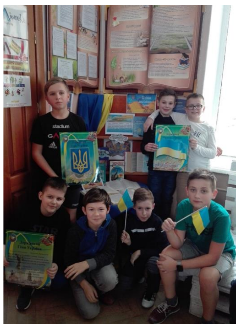
Виставка-досьє «ЗЛУКА.СОБОРНІСТЬ. ВОЛЯ...»