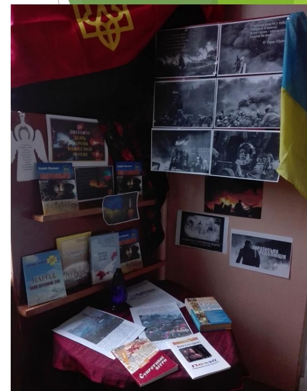
Виставка - пам'ять «Герої не вмирають»