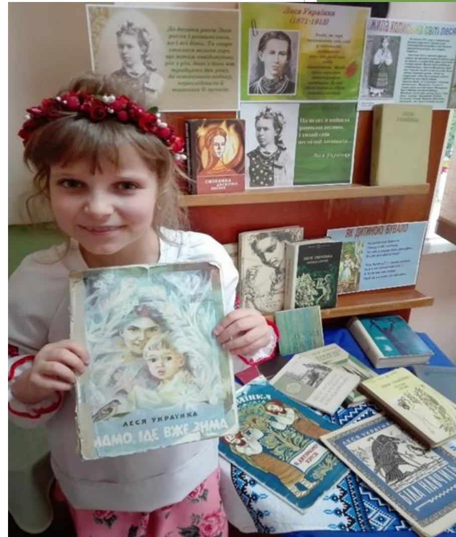
« Довго щирими словами до людей промовлятиму я...» (До дня народження Лесі Українки) Виставка -досєє