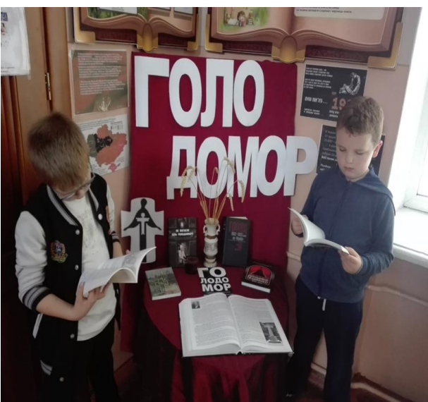
Виставка – роздум « Голодомор: почути через мовчання»