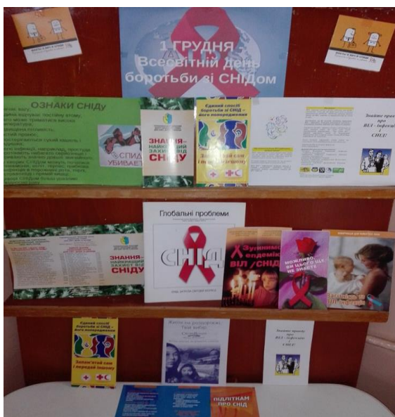
Виставка-порада « Межа, за якою морок»