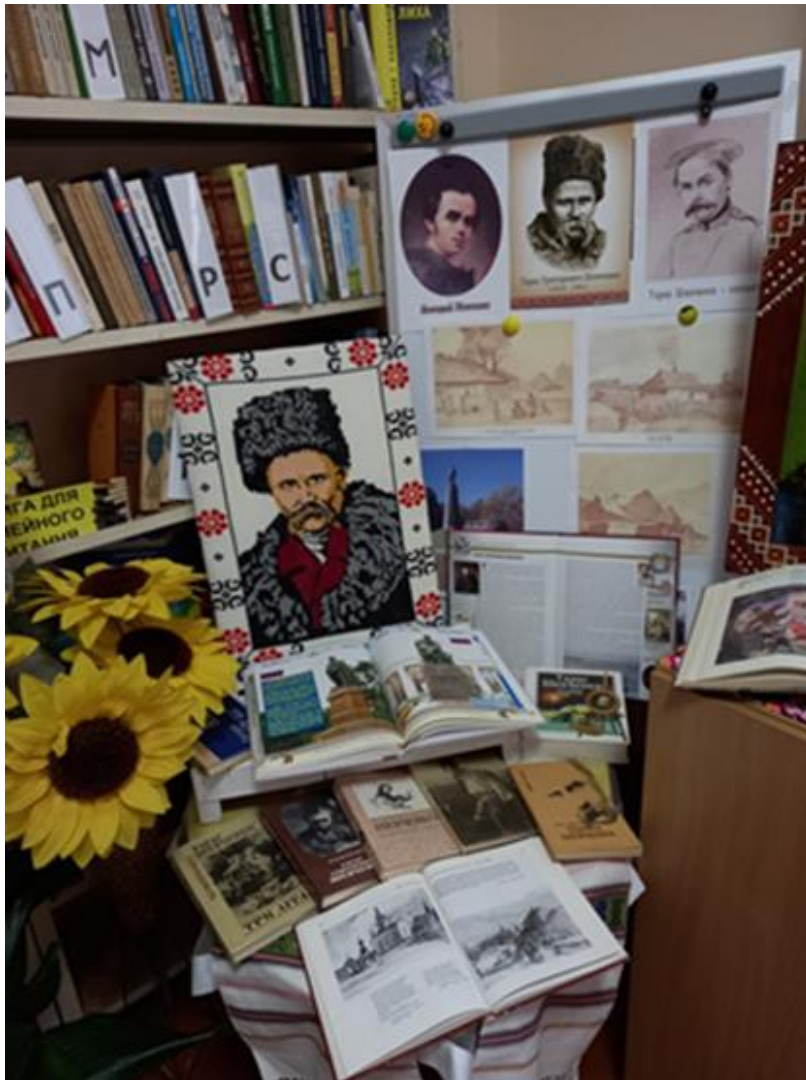
«Шевченковими шляхами» Виставка- мандрівка