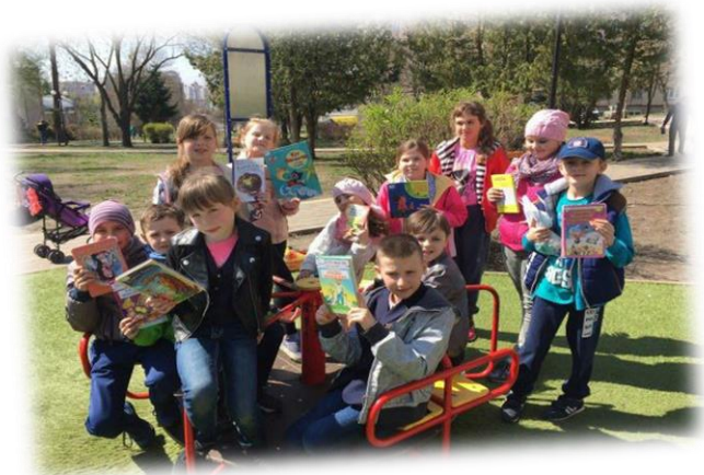
“У СВІТ З КНИГОЮ”