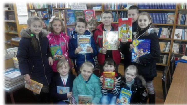
BookCrossing «Порадь книгу для друга»