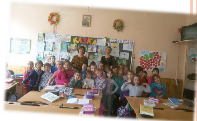
Бібліотечний урок « Дивосвіт Казки»