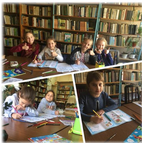
Арт-релакс в бібліотеці