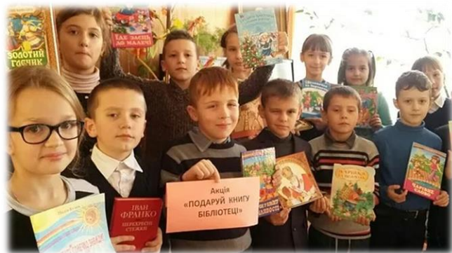
«Подаруй бібліотеці книгу»