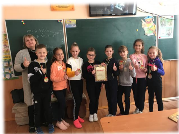
Конкурс «Читай і перемагай»