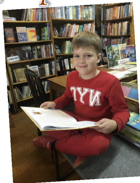
«Я читач шкільної бібліотеки»