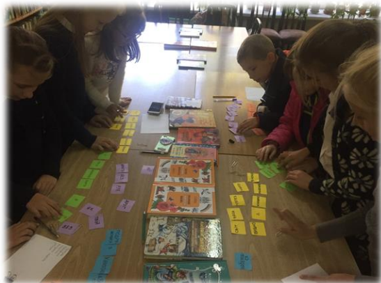
Вікторина «Стежина в зоряний час»