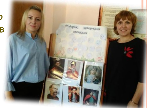
Інтегрований урок «Подорож козацькими стежками»

Шкільна бібліотека - це найважливіше і найперше джерело інформації для вчителів, тому співпраця бібліотеки, батьків і педагогічного колективу є запорукою своєчасного і ефективного впровадження нових освітніх технологій і методів у навчально-виховний процес із метою його удосконалення.