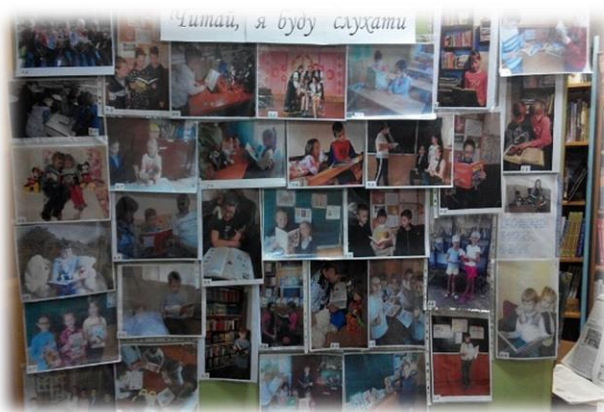
«Читай я буду слухати»