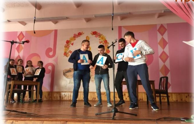
Розважально-інтелектуальні гра «Хто кмітливіший»

Сьогоднішньому школяреві потрібно, щоб інформація подавалася яскраво, динамічно, і бажано коротко. Головне для бібліотекаря - привернути увагу, викликати емоційну реакцію, бажання взяти книгу в руки. Для цього проводяться різноманітні заходи.