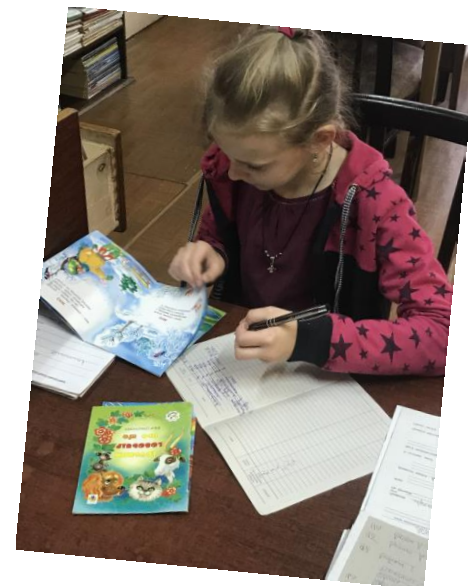
“Бібліотекар на годину”