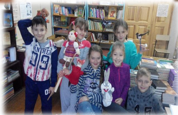
Лялькова вистава «Зайчикова хатка»