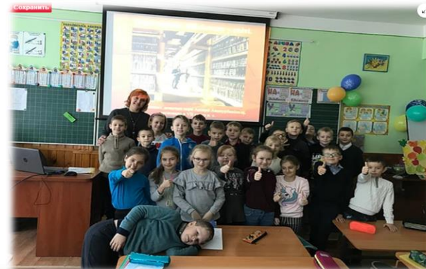
Бібліотечний урок «Як виникла книга»