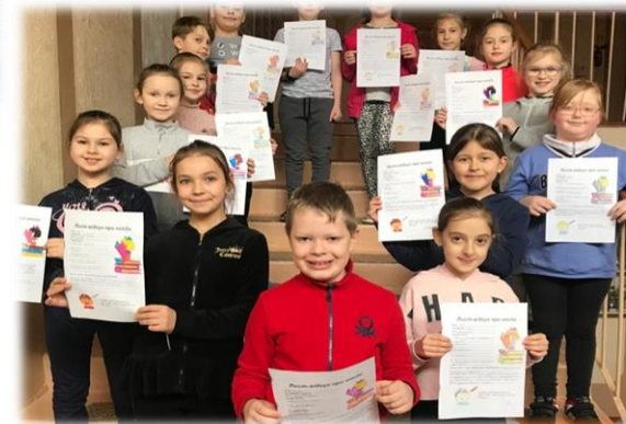
Флешмоб «Враження про книгу»