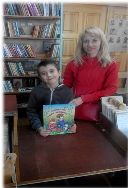
Робота з батьками