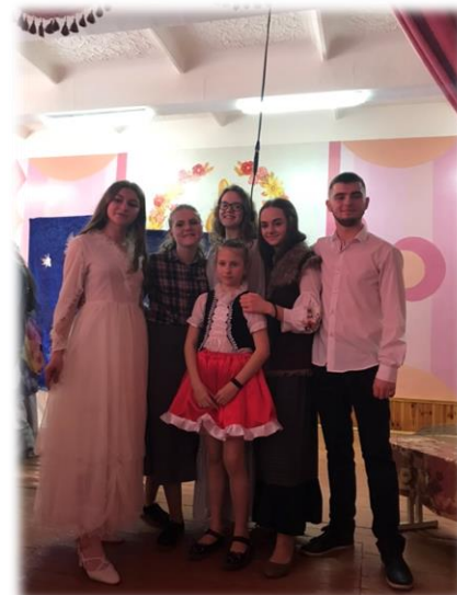
Театралізована вистава "Гензель і Гретель"