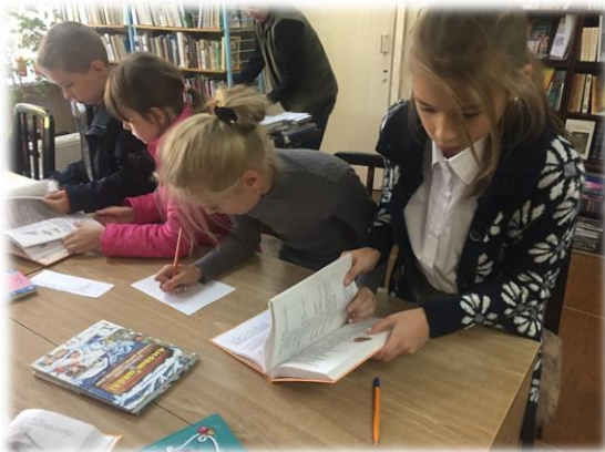
Квест "У пошуках ідеальної книги"