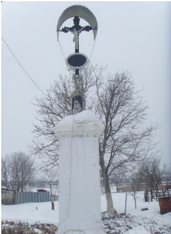
Хрест на вул. Кордулівка

перехрестився, прицілився і не стріляв. Після цього вони вийшли з вул. Кордулівка та зайшли поблизу в кар'єр. Саме там невідомі застрелили першого солдата, що казав стріляти, другого – поранили, а третій залишився живий [10].