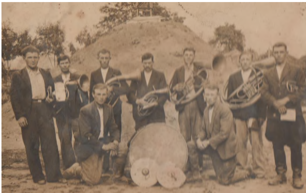
Музики на відкритті пам'ятної могили (1942 р.)

Освячення могили відбулося перед жнивими за участю 7 священників та великої кількості люду Копичинецького повіту.