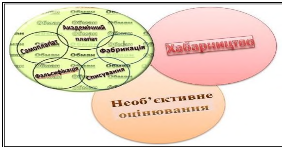
Рис. 1. Основні види порушень академічної доброчесності [4, с. 9]

Види порушень академічної доброчесності, зазначені у п. 4, статті 42 Закону України «Про освіту» [2], можна розділити на три основні категорії: (див. рисунок 1).