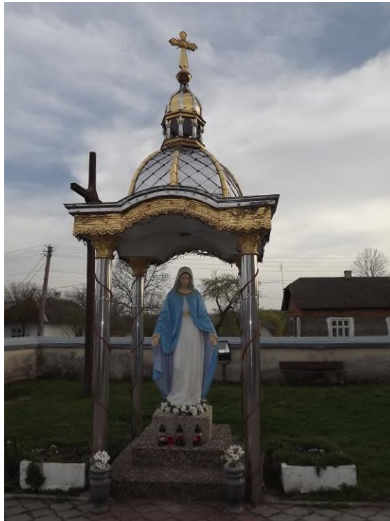
Фігура Матері Божої біля церкви св. Архистратига Михаїла