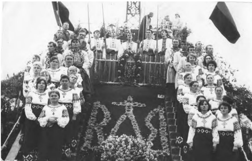
Під час посвячення символічної могили «Борцям за волю України» (21 жовтня 1991 р.)