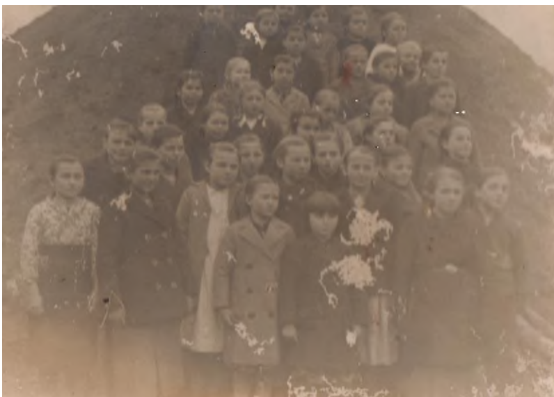
Діти під час відкриття пам'ятної могили «Борцям за волю України»