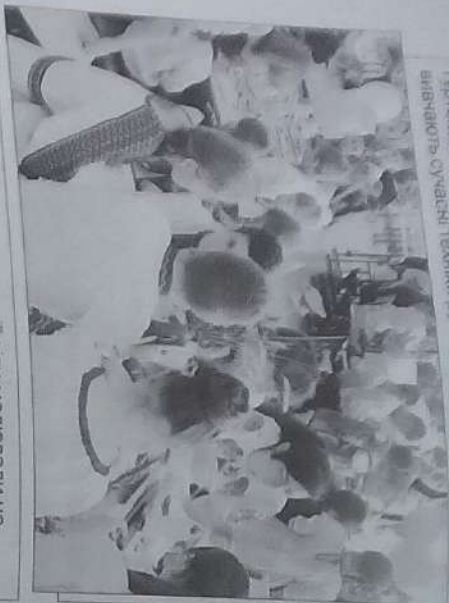
У рамках "Тижня Незалежності" діти малювали на брушці, створюючи гасло даного заходу «Діти України, за мир!»