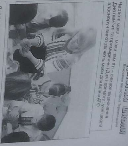
Червоні маки – маки пам'яті – символ відзначення Дня пам'яті та примирення і Дня перемоги. Учні школи власноруч виготовляють маки для воїнів АТО

Україна» тощо (див. фото). Учнями школи, під керівництвом класоводів початкових класів, класних керівників та керівників гуртка декоративно-прикладного мистецтва були виготовлені макети пам'яті – символи відзначення Дня пам'яті та примирення і Дня перемоги, які наразті прийшли на зміну радянській символіці. Саме цими макетами пам'яті школярі прикрашали виставки власноруч листівки для воїнів АТО. З яким трепетом, теплотою діти писали слова влучності солдатам, просили «повернутися живими», побажання скорішого одужання. Діти шире вірять, що їх листівки та побажання обов'язково зірють не одне серце захисників України, їхні ширі молитви допоможуть солдатам повернутися живими і здоровими додому. Слава Україні! Героям Слава!