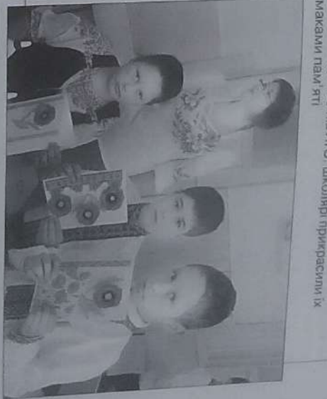
Листівки для воїнів АТО, школярі прикрасили їх макетом пам'яті