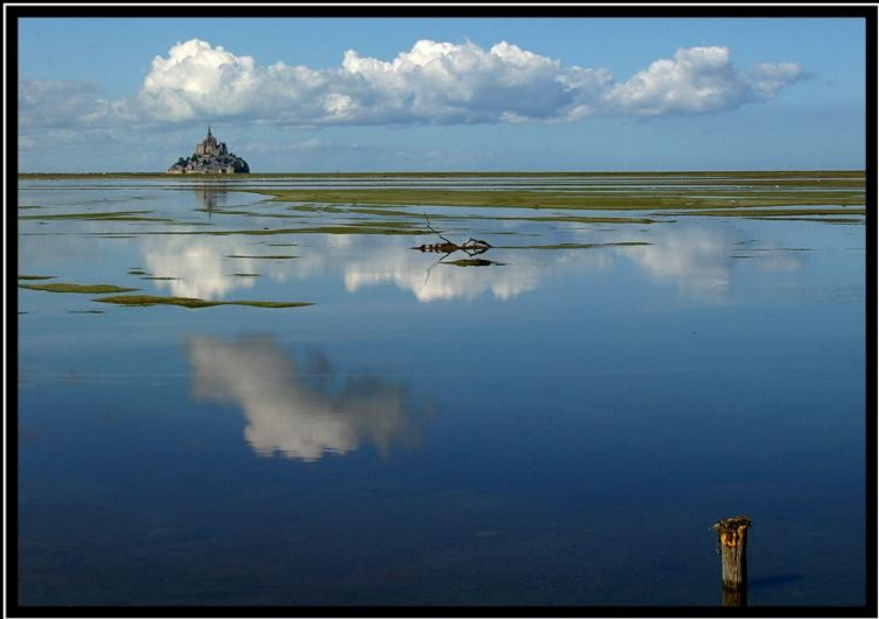
MONT - SAINT - MICHEL