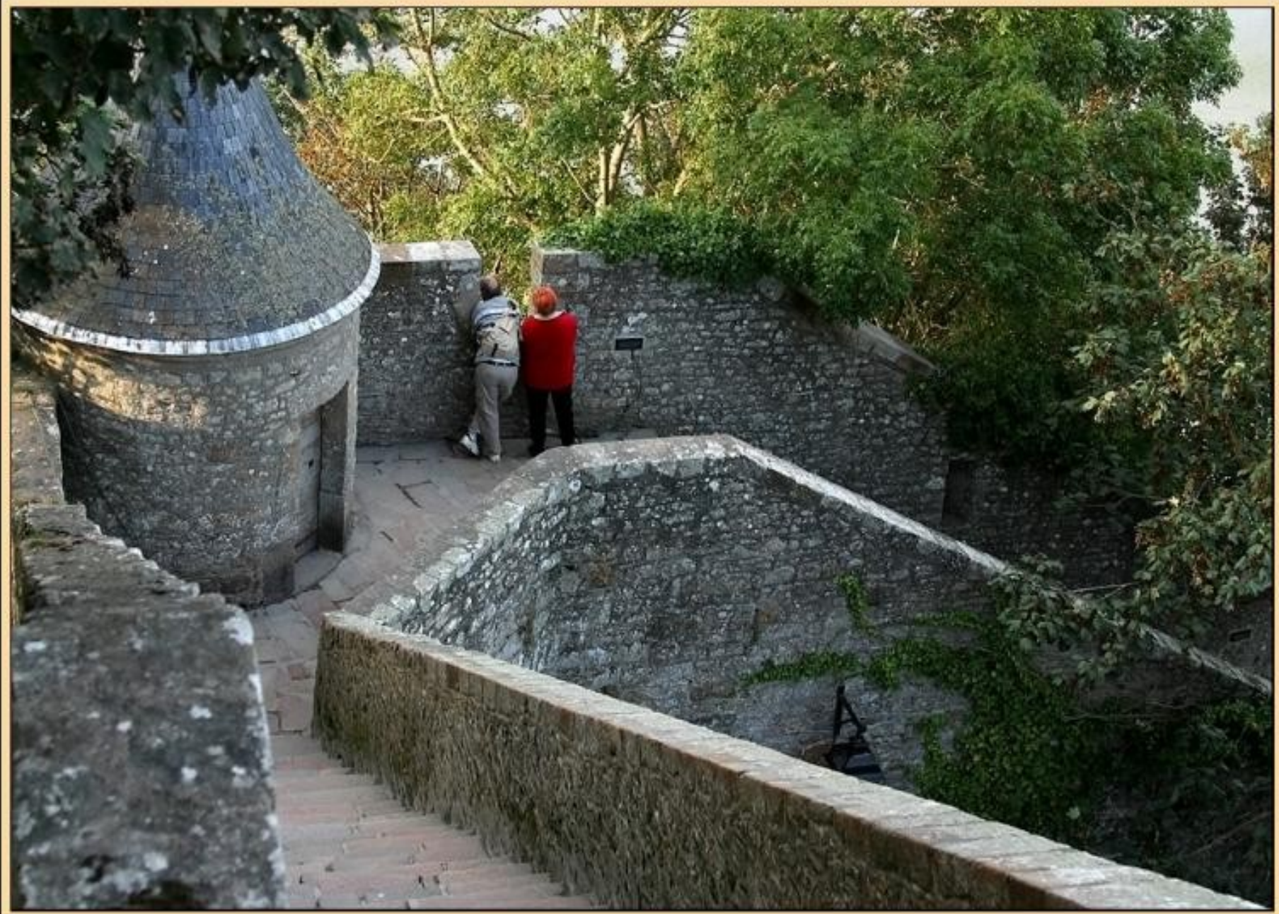
MONT SAINT MICHEL