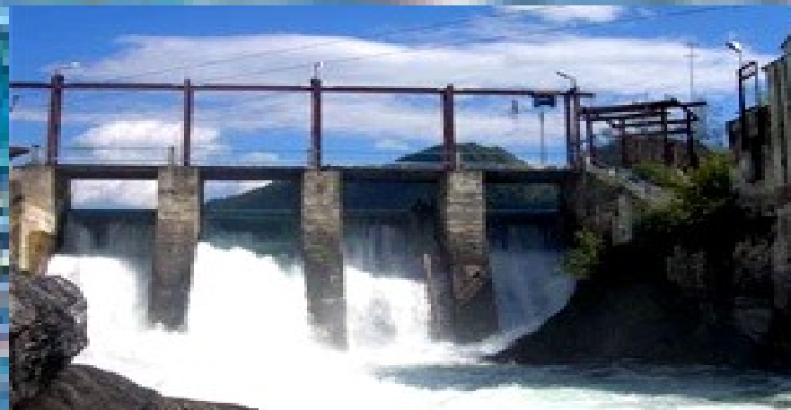
Канал Дніпро – Донбас – Харків