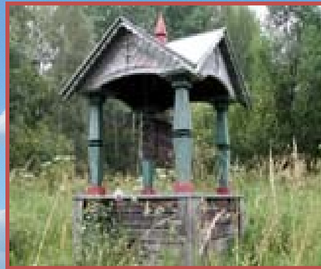
Пам'ятний знак біля витоків Дніпра

Це найбільша річка України, загальною довжиною - 2201 км., на Україну припадає 981 км. Є третя за довжиною і площею басейну річка Європи та головна водна артерія в Україні. Басейн займає 65% площі України. Переважна глибина річки — 3-7 м. Виконує велику господарську роль — у водопостачанні, судноплаванні, виробництві