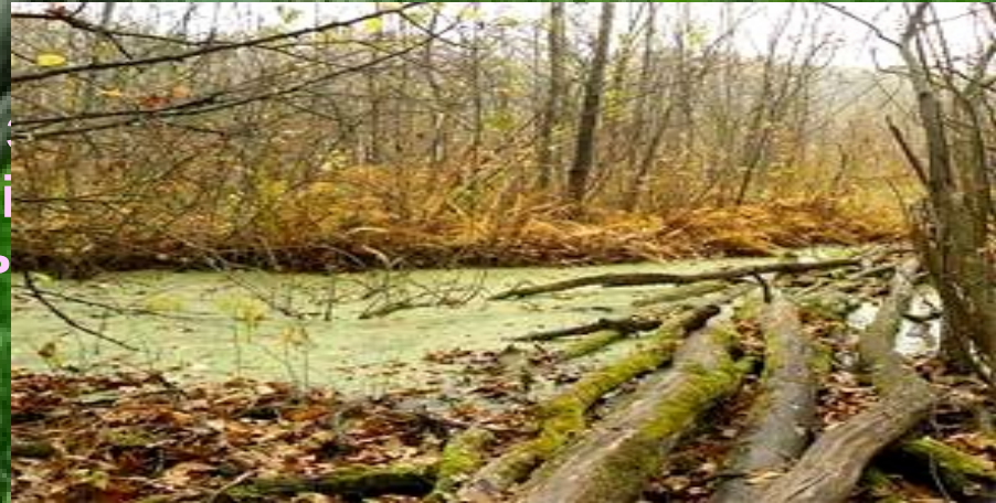
Болото «Чорний ліс»

В Україні болота займають 1/60 від усієї площі. Переважають низинні болота і торфовища. Майже половина всіх боліт осушено. Осушення погіршує гідрологічний режим і водний баланс великих територій.