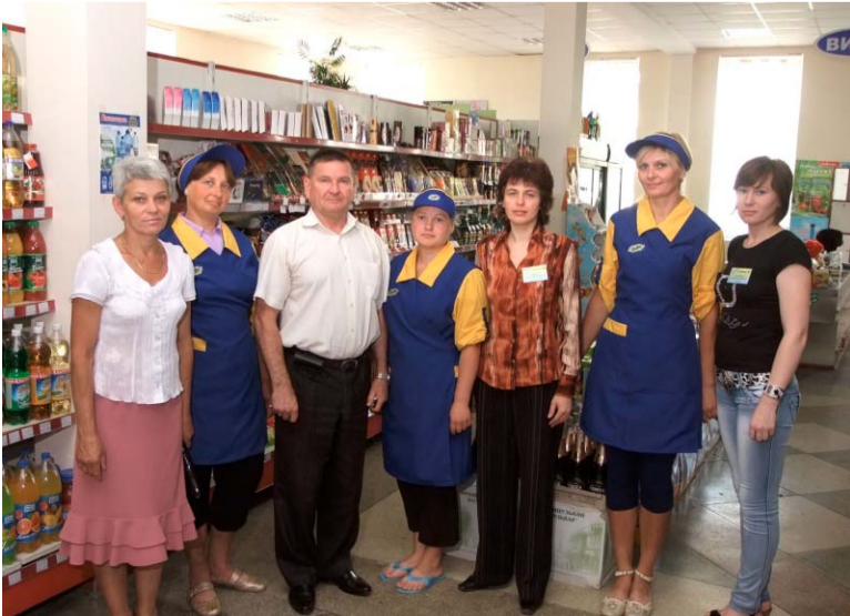
Сумлінно трудяться працівники Шумського маркету «ТеКо».