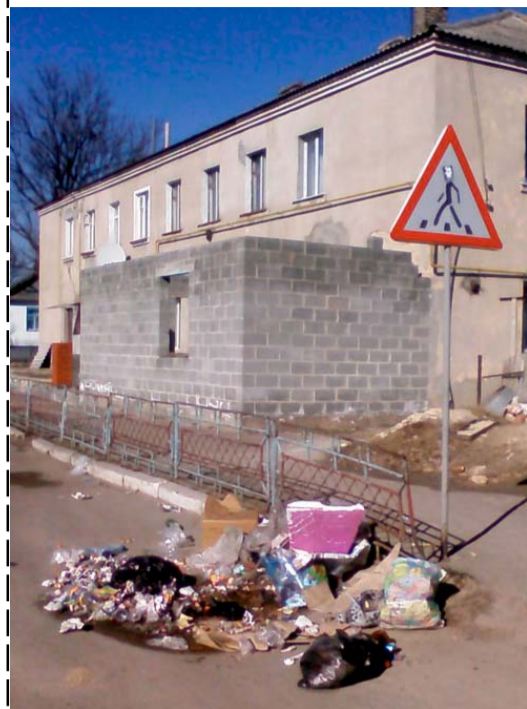
Щонеділі тут – такий "пейзаж. Як кажуть, без коментарів, бо ніхто чужий сюди не прийшов і сміття не викинув. Для себе "старасмося"...