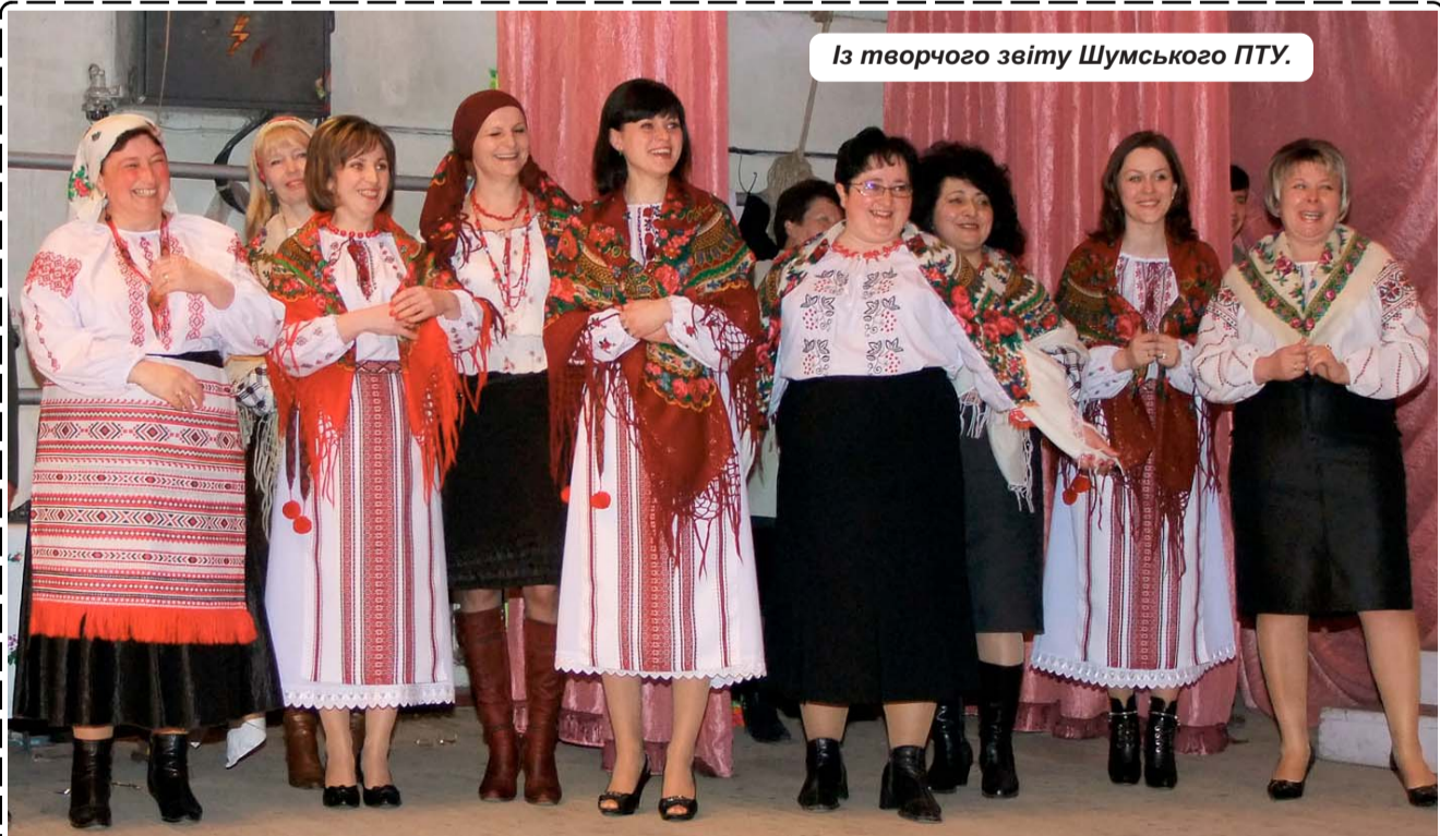
Із творчого звіту Шумського ПТУ.

18 квітня 2011 року, в понеділок, з 11.00 до 12.00, за тел.: 2-15-25 відбудеться "гаряча" телефонна лінія з заступником голови районної державної адміністрації Світланною Леонтівною ДЕМЧУК.