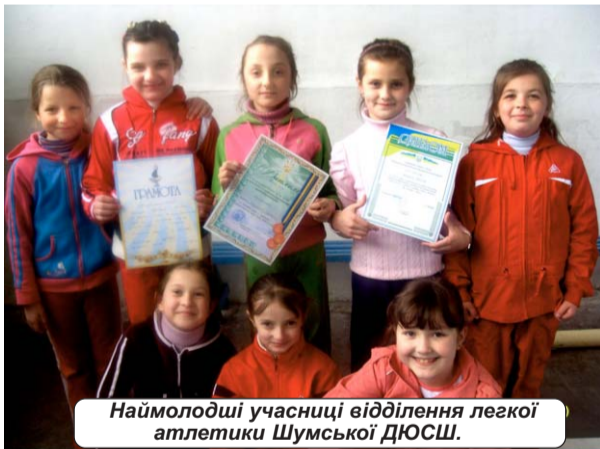
Наймолодші учасниці відділення легкої атлетики Шумської ДЮСШ.