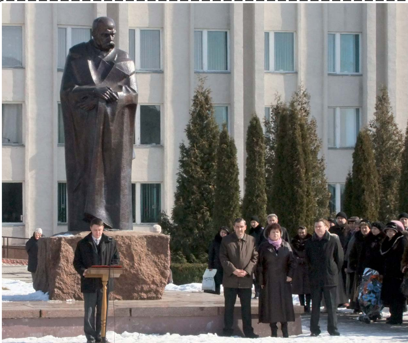
На Шумщині відзначили Шевченківські дні. Репортаж читайте на 2-ій стор.

Газета районної ради, районної державної адміністрації, міської ради, трудового колективу районного інформаційного центру "Новини Шумщини"