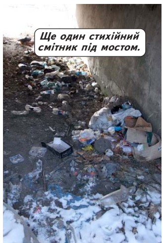
Ще один стихійний смітник під мостом.

Початок року в Україні відзначився не лише суворою зимою, але й великою кількістю нещасних випадків, пов'язаних з використанням газу в побуті. Лише у січні-лютому їх сталося 22, постраждало 49 людей, з них 22 загинули (в тому числі, від отруєння чадним газом – 17, від вибухів – 5). У м.Житомир 3 лютого, внаслідок отруєння чадним газом від працюючих самовільно встановлених газових приладів, загинули чотири особи. 7 лютого у багатоквартирному двоповерховому житловому будинку м.Донець трое людей смертельно отруїлися чадним газом під час експлуатації газового водонагрівача через засмічення димового каналу.