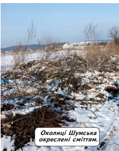
Околиці Шумська окреслені сміттям.