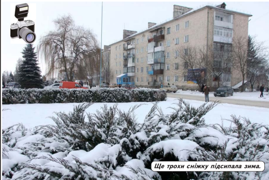
Ще трохи сніжку підсипала зима.