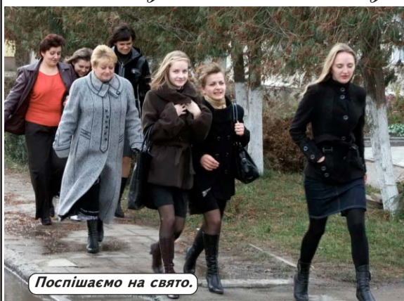
Поспішаємо на свято.