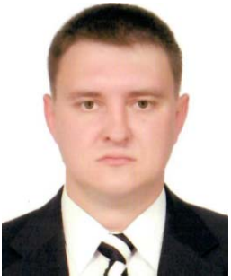
САДОВСЬКИЙ Віктор Анатолійович , голова Шумської районної державної адміністрації.