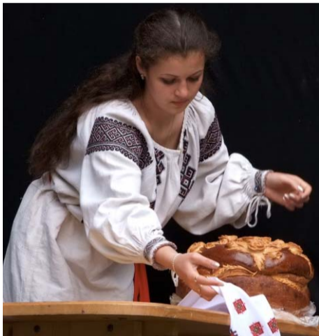
села Шумщини, зачаровували усіх присутніх призабутими народними обрядами, пов'язаними з весільним циклом, обжинками. Навіть травнева гроза, яка шуміла того дня, не відлякала гостей. Вперше на фестивалі вибирали найкращий національний костюм. Кожен бажаючий мав можливість проде-