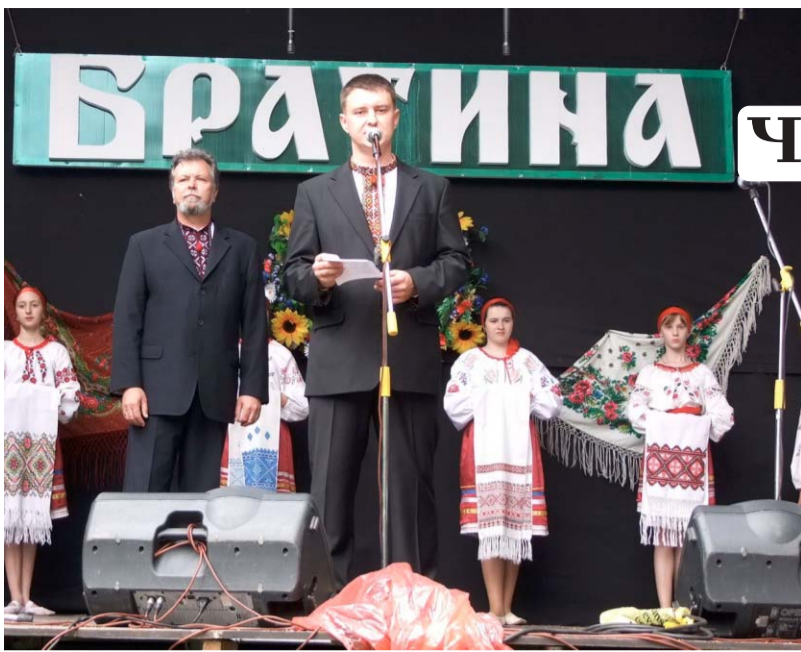
Фольклорні гурти Хмельницької, Рівненської, Тернопільської областей, з Білогір'я, Кременця, Лановець, Гаїв Стрітенських, майже з кожного