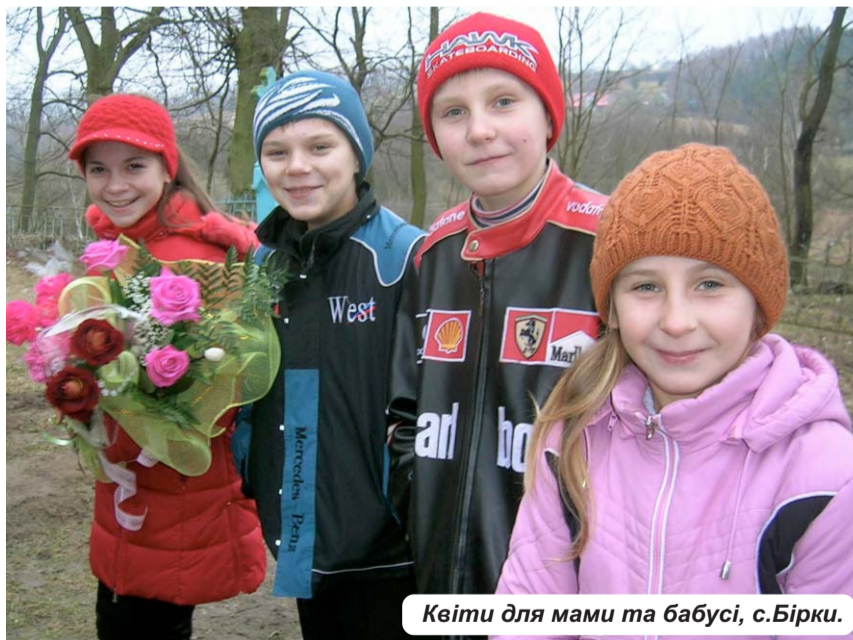
Квіти для мами та бабусі, с.Бірки.