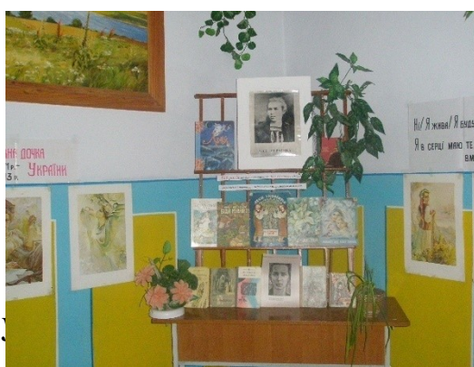
Книжкова виставка « Леся »

Такі виставки, як «Голодомор1932-1933рр.», «Мій рідний край – моя земля», «Література рідного краю», «Від народних джерел», «Мова – духовне багатство народу».