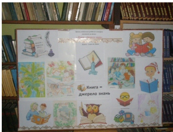
Конкурс малюнків « Книга- джерело знань»

Діти ростуть і з кожним роком потребують більше інформації. Не секрет, що одним із джерел її отримання в сучасних умовах є Інтернет. Використання комп'ютера та мережі Інтернет не тільки спрощує роботу бібліотекаря, а й надає можливість швидко знаходити потрібну інформацію, ефективно забезпечувати та задовольняти інформаційні потреби учнів і педагогів.