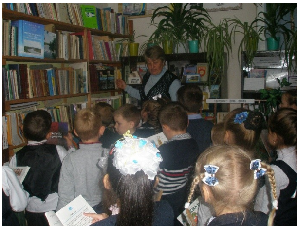
Бесіда-екскурсія по бібліотеці «Знаюмство з шкільною бібліотекою» 1 клас