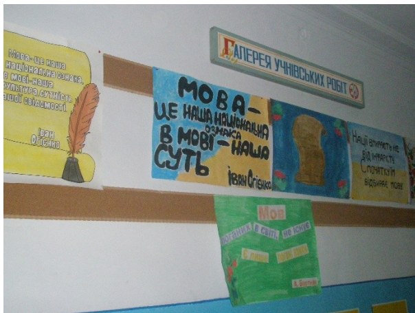
Конкурс плакатів « Мова – наше багатство»