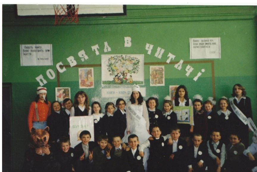
Свято « Посвята в читачі»