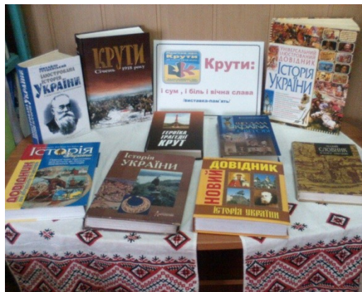
Книжкова виставка на тему « Крути: і сум, і біль, і вічна слава»

Для інформаційного забезпечення таких заходів добираються нові матеріали: розробляється план проведення, готується сценарій для загальношкільної лінійки, оформлюються книжкові виставки, підбирається ілюстративний матеріал, конкурси малюнків, плакатів.