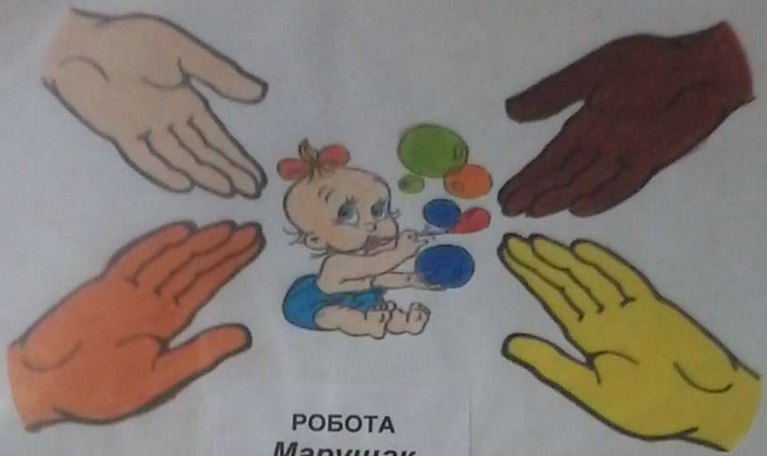
РОБОТА Марушак Наталії