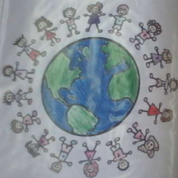
РОБОТА Рудницької Анастасії