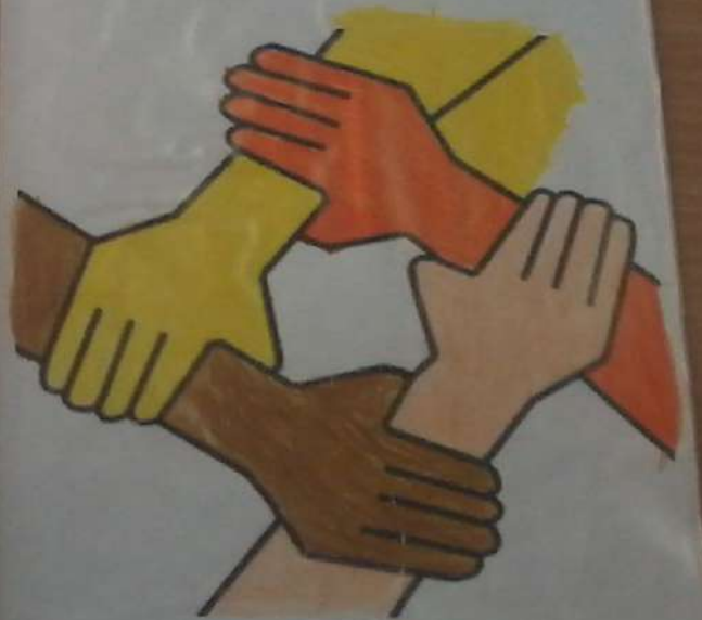
РОБОТА Іванини Ілони