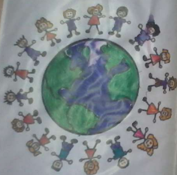
РОБОТА Цупера Максима