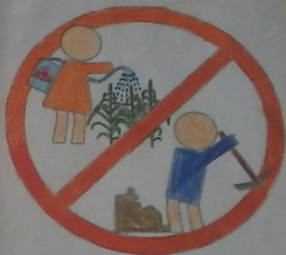
РОБОТА Недогіна-Бугая Максима